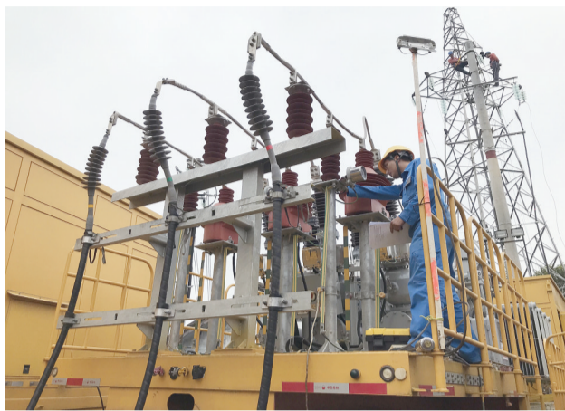
施工人员对35千伏变电车进行设备检查

据介绍,此次高峰变电站升级改造工期预计9个月,涉及3个35千伏变电站全停、7条10千伏线路、1条35千伏线路、2个35千伏公用变电站,以及中压用户75个、低压用户