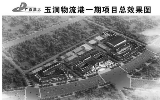
玉洞物流港一期项目总效果图